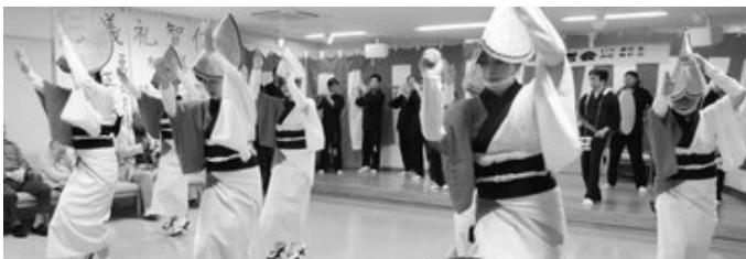
長根地区阿波踊り

また、高の巣地区の八幡神社例祭、八布地区の八布神社例祭、新田地区の菅原神社の例祭が神山神社例大祭の前週と翌週にあります。コロナウイルスの情勢を見ながら慎重に行っていたいただきますようお願い致します。